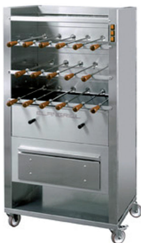
UAFM 17 17 espetos