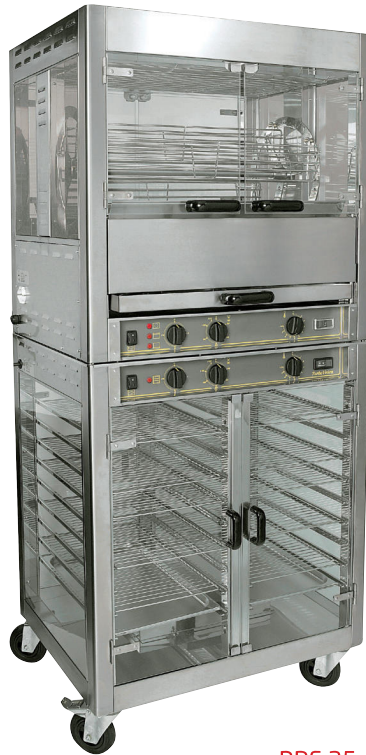
RBE 25 + RE 2