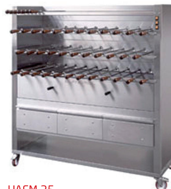
UAFM 35 35 espetos