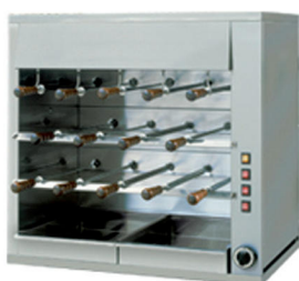
UAF 14 E 14 espetos