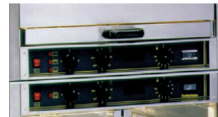
Encaixe do assador RBE25 + Estufa RE2 Enboîtement de la rôtissoire RBE25 + étuve RE2 Encaje del asador RBE25 + estufa RE2 RBE25 roaster + RE2 stove