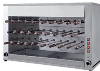
UAF 29G 29 espetos