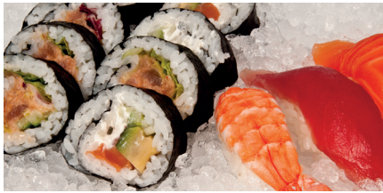
DRY ICE | HIELO SECO | PERLES OU GLAÇONS - ICE QUEEN 50C/85C

There is a full range of ITV storage bins to choose. The ICE QUEEN flaker comes complete with water filter, scoop and bin ice distributor. It is available in 220v/50Hz, 220v/60Hz, 115v/60Hz and triphase 380v and can be air or water cooled.