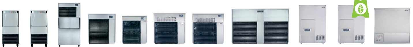
ICE QUEEN 50C ICE QUEEN 85C ICE QUEEN 135C ICE QUEEN 150 ICE QUEEN 200 ICE QUEEN 400 ICE QUEEN 550 ICE QUEEN 1100 GENERATOR IQ550 GENERATOR IQ850 CO2 GENERATOR IQ1100