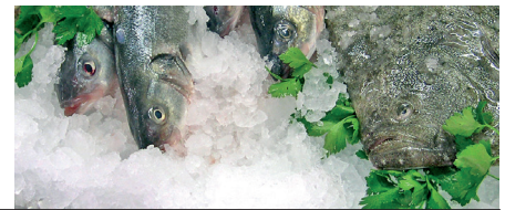
ICE FLAKERS | HIELO TROCEADO | GLACE À PAILLETTE

La carrosserie est entièrement en acier inoxydable AISI 304, facilement démontable. Il y a une ample gamme de bacs de stockage de glace marque ITV. La machine ICE QUEEN inclut une filtre à eau, une pelle et un distributeur de glace dans le bac. La machine est disponible en 220v/50Hz, 220v/60Hz, 115v/60Hz et triphasé 380v et réfrigérée par air ou par eau.