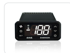
Painel de controlo com dispositivo electrónico