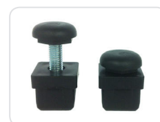
Pés de nivelamento