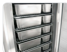
Suporta até cinco contentores para gelado por grelha