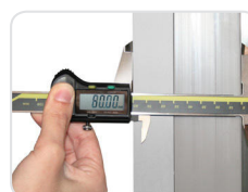
Isolamento ecológico com 80 mm de espessura