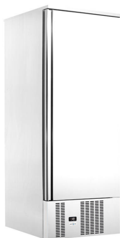
Aço pré-lacado branco