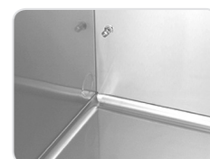
Cantos interiores arredondados

O Armário de Gelados Invertido D1 é um armário versátil preparado para o armazenamento de gelados. Os suportes contêm 5 grelhas GN 2/1N e podem conter até quatro grelhas adicionais, com um espaçamento de 140 mm. Interior 100% em aço inoxidável, com dois acabamentos exteriores alternativos, aço inoxidável ou aço pré-pintado branco.